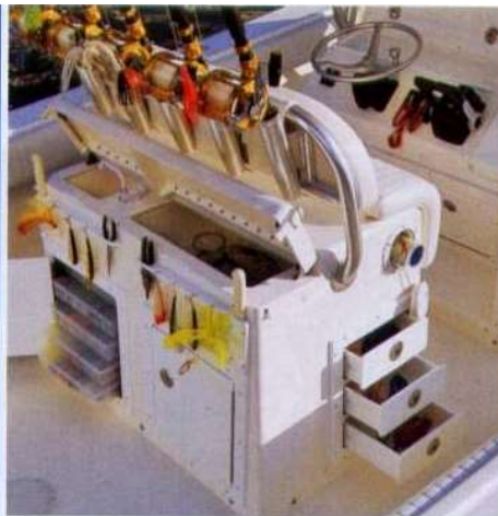
Sopra, il leaning post del 32 CC, attrezzato con cassetti e vani per esche, ami e mulinelli; a richiesta anche sui modelli più piccoli. Sotto, lo specchio di poppa del 26 piedi ingloba vasche per vivo e pescato.

tentano di una semplice barca per andare a pescare ma desiderano un offshore da pesca caratterizzato da prestazioni, qualità e comfort unici nel loro genere. Si tratta di quattro center console rispettivamente di 23, 24, 26 e 32 piedi, tutti proposti in due versioni. La versione da "pesca pura", denominata CC, prevede una zona prodiera completamente priva di ingombri in modo da facilitare l'attività, mentre nella versione FS, quella più apprezzata dalle signore, la zona prodiera è attrezzata con sedute realizzate in controstampo, che possono essere servite da un tavolino in modo da creare una piacevole dinette o da essere trasformate in una confortevole superficie prendisole. Già a livello progettuale tutti i Regulator sono stati concepiti per essere motorizzati con fuoribordo 4 tempi che, come noto, hanno pesi ben superiori ai 2 tempi e quindi necessitano sia di una maggiore robustezza delle sezioni poppiere sia di un diverso equilibrio dello scafo. Allo scopo di ottenere il massimo anche in assetto, il cantiere ha inoltre scelto di dotare tutti i suoi modelli di particolari flap appositamente studiati per queste motorizzazioni. Ci troviamo dunque di ►